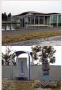
爰しんの里記念館

親鸞聖人の妻、恵信尼が晩年に暮らし、この地で亡くなったと言われています。恵信尼が建てた五輪の供養塔が安置されています。