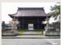
東本願寺高田別院

高田別院の前身、高田掛所は本願寺代17代真如上人の時代(1730年)に8年に及ぶ嘆願で建立しました。